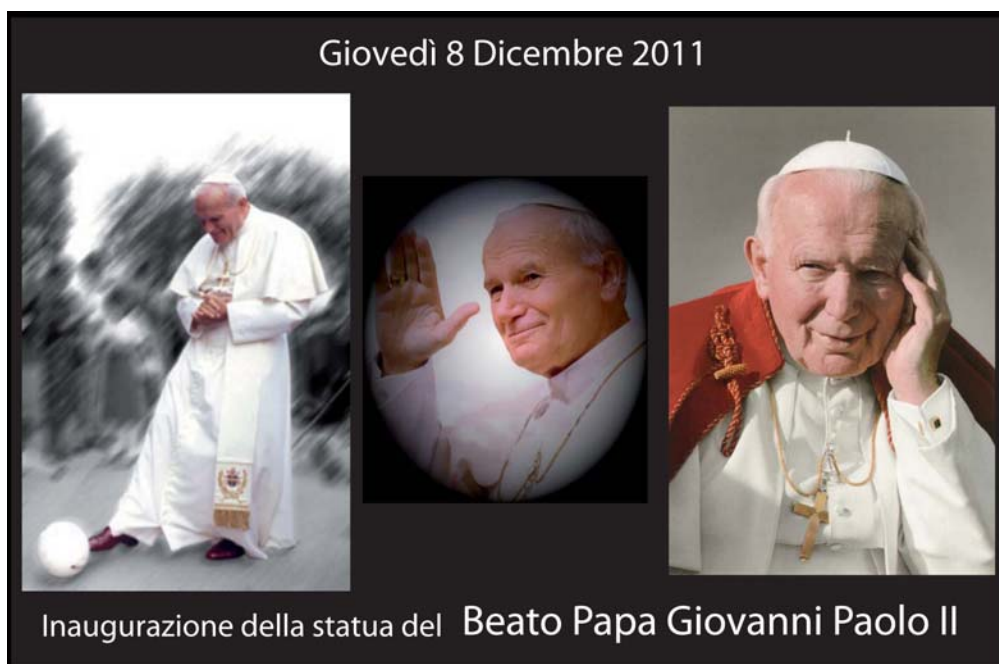
La cartolina raffigurante tre intense immagini del pontificato del Beato Giovanni Paolo II